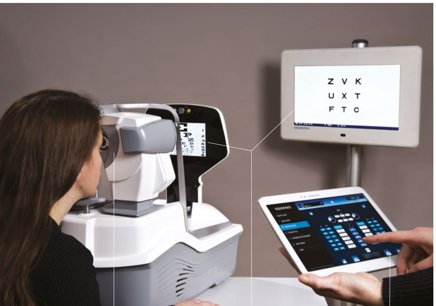
Vollautomatisch: Eye-Tracking, Autofokus.